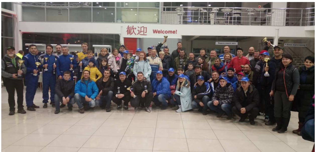
«TEAM» - это командный зачет, с требованиями согласно регламента.

«TUNING» - это серийный класс без деления объёма двигателя, с дистанцией как у стандарта, с дополнительными требованиями по обеспечению безопасности и может допускать большое количество переделок (согласно тех требованиям).